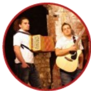
Le Coup de Grisou