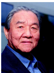
Ikutaro Kakehashi Fondateur de Roland Corporation

Roland, leader mondial des instruments de musique électronique est fier d'être associé à L'Odyssée de l'Accordéon, cette initiative qui célèbre l'accordéon sous toutes ses formes musicales et je lui souhaite longue vie.